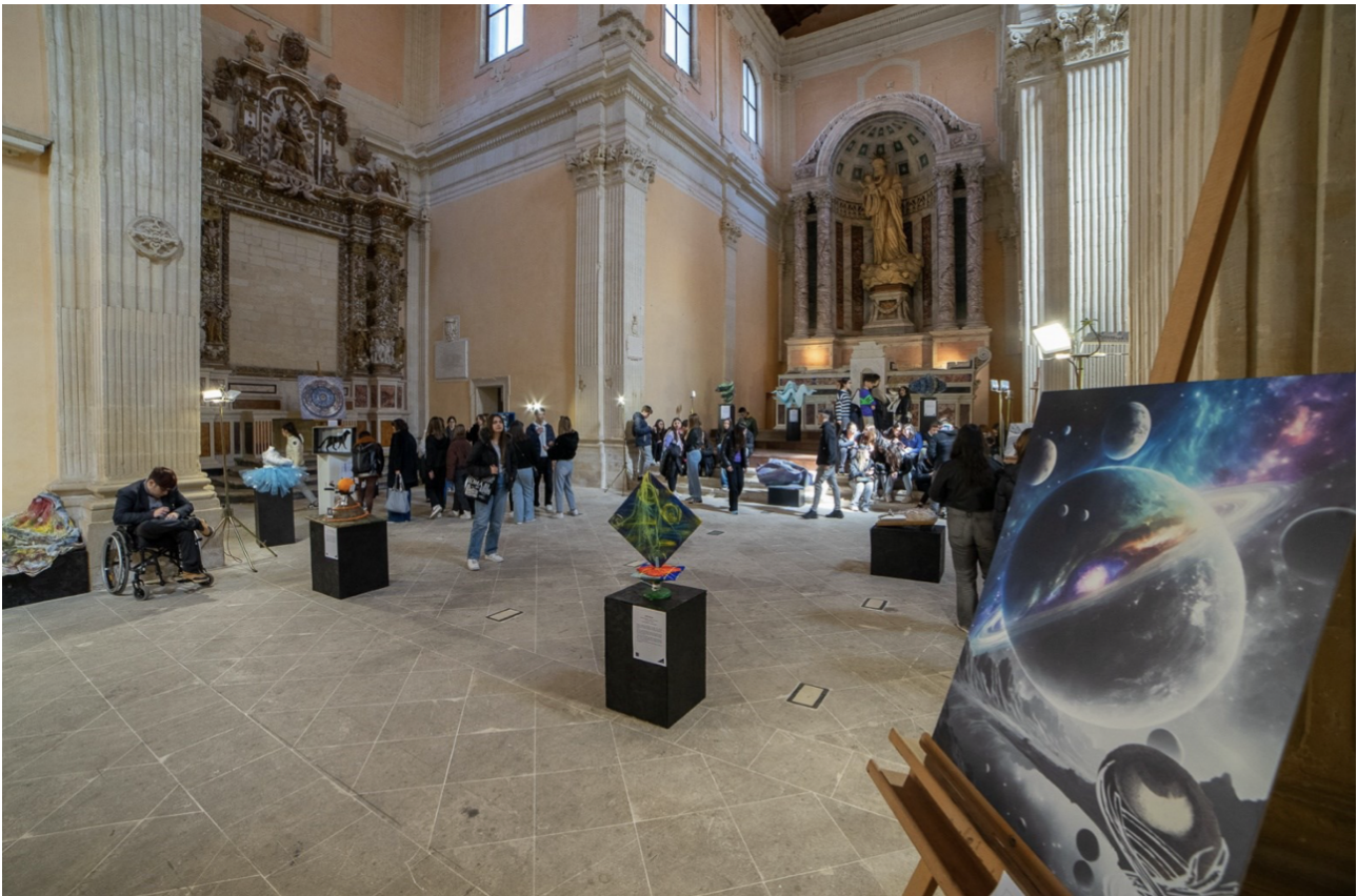
Figura 3: Edizione 2024 di Lecce, allestita nella ex Chiesa di San Francesco della Scarpa.

studenti e istituzioni. Quest'anno, l'interesse per la competizione è cresciuto enormemente, alimentando un nuovo fervore attorno all'iniziativa e aprendo nuove opportunità di crescita e collaborazione per il futuro.