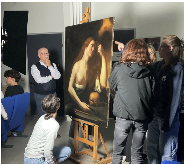
Figura 1: Lezione di Archeometria a Ferrara. https://www.facebook.com/artandscienceacrossitaly/posts/

stessa. Questa prospettiva va oltre il campo delle arti visive e si concentra sull'esplorazione di ogni forma d'arte come mezzo per comprendere e rappresentare aspetti della realtà che sono altrimenti invisibili e che costituiscono l'oggetto della ricerca scientifica. Obiettivo è avvicinare gli studenti alle scienze stimolando il loro interesse e migliorando le loro competenze attraverso un approccio interdisciplinare alla conoscenza.