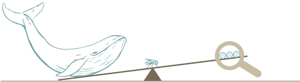
Figura 2: Meccanismo grafico per rappresentare in modo tangibile la estrema differenza tra i parametri che, nel cosiddetto modello del see-saw (altalena, in inglese), definiscono le scale di massa per i neutrini. I rapporti tra la massa della balenottera, del moscerino e del DNA corrispondono correttamente ai rapporti tra i valori dei parametri presenti in questo modello di fisica del neutrino, nel quale l'altalena rappresenta un meccanismo matematico che viene invocato per spiegare perché la massa dei neutrini che osserviamo sia così piccola. Nell'immagine, la piccolissima massa dei neutrini è rappresentata appunto dal DNA, ed è messa in relazione a una massa intermedia, quella del moscerino che funge da fulcro per il meccanismo, e quella molto grande della balenottera. (Riprodotta da [4] - © Infn-Asimmetrie).

in modo plastico l'enorme differenza tra questi valori. La massa dei neutrini (piccolissima) qui è rappresentata dal DNA. La creazione di questa grafica è stata istruttiva anche per il comitato di redazione della rivista, in quanto non si riuscivano a trovare 3 animali che avessero masse così diverse tra di loro, tanto quanto lo sono i parametri del modello dei neutrini! Per questo motivo da un lato si è messo il più grande animale conosciuto (la balenottera) mentre dall'altra parte, per rappresentare i leggerissimi neutrini, si è dovuto scendere al livello non di un essere vivente ma addirittura del DNA. Anche fare divulgazione può dare interessanti spunti di riflessione a chi la fa!